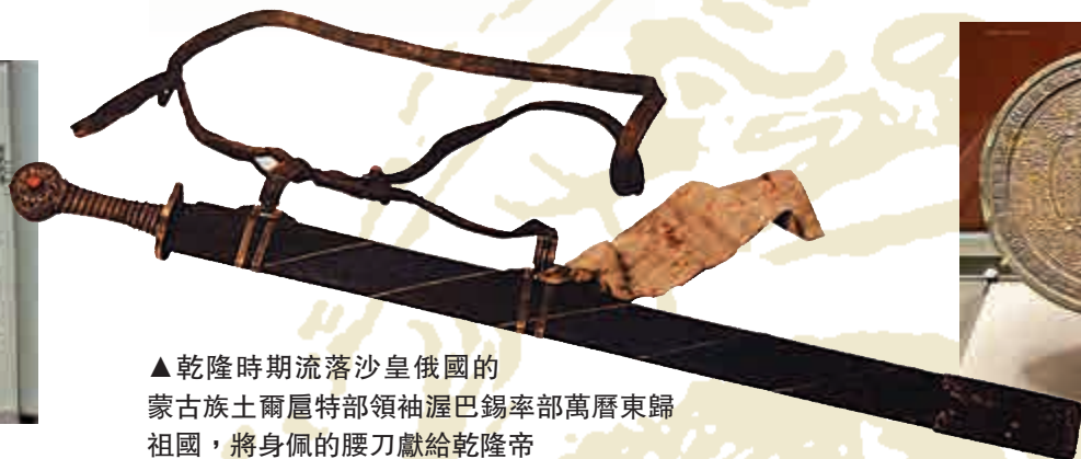
▲乾隆時期流落沙皇俄國的蒙古族土爾扈特部領袖渥巴錫率部萬曆東歸祖國，將身佩的腰刀獻給乾隆帝