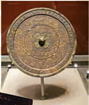
◀「中國大寧」鑲金青銅鏡