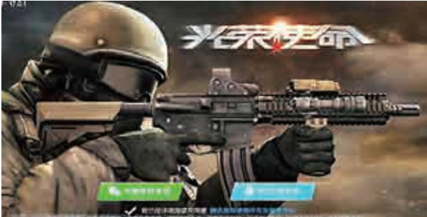
▲《光榮使命》

，槍械選擇則包括98K、M4A1、AK47、MP5等，以及醫療險、綑帶等醫療用品。也能看到跳傘、擊殺變盒子的元素。 《光榮使命》採用動態光影，LOD優化等技術，同時具備6種天氣模式，騰訊稱會給予玩家「大片般的享受」。