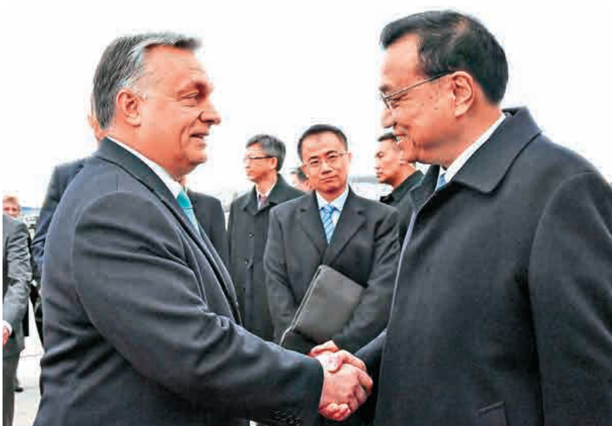
▲匈牙利總理歐爾班到機場迎接來訪的中國總理李克強，兩國總理親切握手寒暄，熱情問候。

11月30日至12月1日，李克強還將出席在俄羅斯索契舉行的上海合作組織成員國政府首腦（總理）理事會第十六次會議。今年6月上合組織阿斯塔納峰會吸收印度和巴基斯坦成為正式成員，上合組織不僅是陸上絲綢之路經濟帶建設平台，也連接海上絲綢之路，聯動亞歐兩大市場。商務部部長助理李成鋼透露，中方正攜手各方進行精心籌備，進一步推動貿易便利化、電子商務、服務貿易、智庫交流等領域的務實合作。