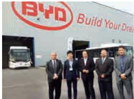
▲今年9月11日，比亞迪匈牙利電動大巴及卡車工廠首台大巴整車K9UB下線儀式在科馬羅舉行。網絡圖片

【大公報訊】據中新社報道：李克強是次出訪匈牙利，是今年5月中匈建立全面戰略夥伴關係以來中國領導人首次訪匈。中國國際問題研究院常務副院長阮宗澤表示，匈牙利等一些中東歐國家又叫「轉型國家」，冷戰結束後轉型國家的經濟體制