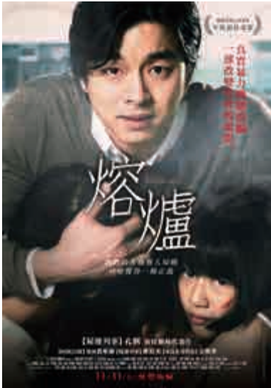
完善 ▲韓國電影《熔爐》促進韓國未成年人保護法的資料圖片

如今我們都長大成人，甚至有的人已經為人父、有的人也已經為人母，卻看到本應該被好生照顧善待的小孩子們被這群人渣侵犯，那些有孩子的父母開始為自己孩子的成長環境擔心，那些沒有孩子的人們更沒有了想生育的打算。而我們最不希望看到的結局莫過於那些衣冠禽獸逍遙法外，得不到應有