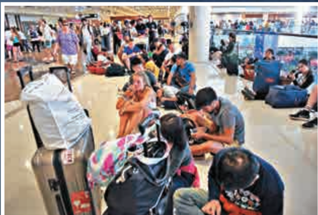
▲大批旅客滯留峇里島機場