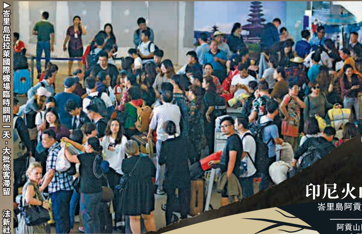
▲峇里島伍拉萊國際機場臨時關閉一天，大批旅客滯留