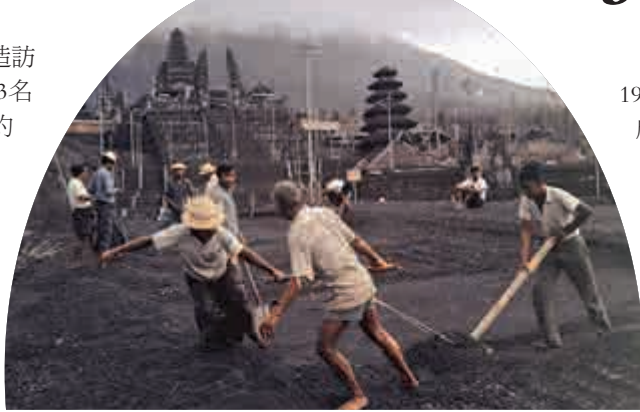
▲1963年阿貢火山爆發時，村民逃難的場景

峇里島去年有近500萬名外國旅客造訪，澳洲、中國及日本旅客人數皆前3名。根據印尼政府統計，峇里島每個月約有50萬名遊客造訪。不過，受阿貢火山從今年9月開始活動加劇的影響，峇里島今年的旅遊觀光收入，損失慘重。印尼國家災害應變總署發言人蘇托波日前估計，阿貢火山活動加劇這段期間，峇里島的旅遊收入下降了4成，造成經濟損失約1.47億美元。