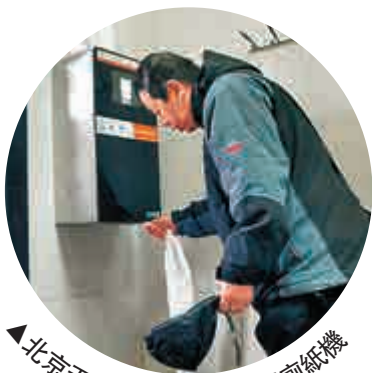
▲北京天壇公園的人臉識別廁紙機