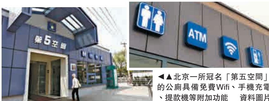
▲北京一所冠名「第五空間」的公廁具備免費Wifi、手機充電、提款機等附加功能

2015年4月，習近平總書記曾經就「廁所革命」作出重要指示，強調抓「廁所革命」是提升旅遊業品質的務實之舉。冰凍三尺，非一日之寒。要像反對「四風」一樣，下決心整治旅遊不文明的各種頑疾陋習。要發揚釘釘子精神，採取有針對性的舉措，一件接着一件抓，抓一件成一件，積小勝為大勝，推動我國旅遊業發展邁上