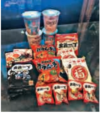
▼日清昨向與會機構投資者大派「美食大禮包」

【大公報訊】香港人從細食到大的出前一丁製造商日清（01475）昨日舉行路演，向與會機構投資者大派「美食大禮包」，除了海鮮味合味道、出前一丁麻油麵、出前一丁棒打麵、福字伊麵和香辣味激辣魔薯外，還有早兩個月才推出的海鮮味合味道樂怡。雖然「美食大禮包」僅約值36元，但因內藏一對特別版杯碗麵專用「清仔」和「清妹」杯緣子，吸引分析員「返轉頭拎多幾份」。現場所見，有分析員「去而復返」，