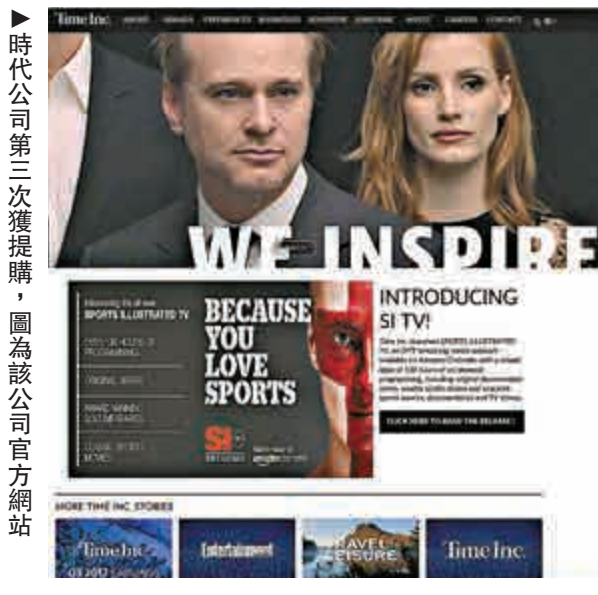
▶時代公司第三次獲提購，圖為該公司官方網站

美國傳媒集團梅瑞迪斯（Meredith）計劃以18.5億美元（約144.3億港元），收購時代公司（Time）。外媒報道稱，梅瑞迪斯獲得億萬富翁科赫（Koch）兄弟的資金支持。在計入時代公司的債務後，該宗交易的估值為28億美元（約218.4億港元）。