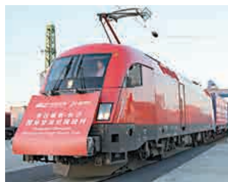
▲27日，布達佩斯至長沙國際貨運回程班列在布達佩斯首發。

據統計，2016年，中匈兩國雙邊貿易額達88.9億美元，比上年增長10.1%。2017年，雙邊貿易保持增長勢頭，上半年達到48.5億美元，同比增長17.3%。