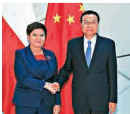
▲27日，李克強在布達佩斯下榻飯店會見波蘭總理希德沃。

希德沃表示，波方重視對華關係，希望發揮兩國政府間合作委員會作用，挖掘經貿投資合作潛力，加強基礎設施建設、物流、農業等領域互利合作。「16+1合作」是波中雙邊關係的有益補充，有利於波蘭和中東歐國家發展，波方願同中方共同努力，推動「16+1合作」取得更大成績。