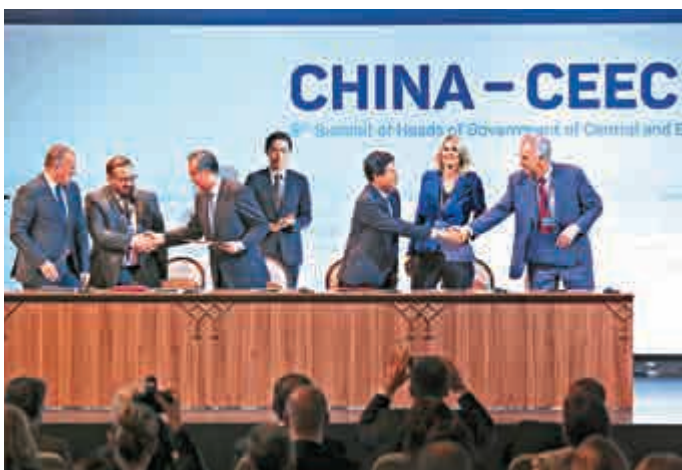
▲27日，中國—中東歐國家領導人共同見證有關「一帶一路」、互聯互通等各項合作文件的簽署。

此外，愛沙尼亞地理位置優越，瀕臨波羅的海，首都塔林一度是連接中東歐和南北歐的交通要塞，被稱為「歐洲的十字路口」。以愛沙尼亞為支點，中國電商企業可更好向周邊輻射延伸。