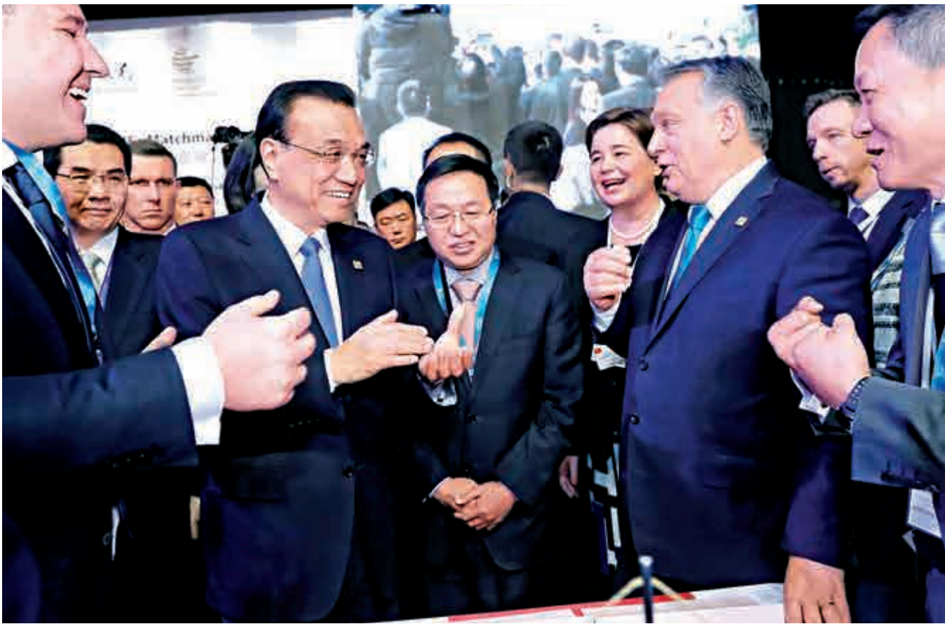
▲27日，中國國務院總理李克強與匈牙利總理歐班、波蘭總理希德沃在布達佩斯會晤，共同見證有關「一帶一路」、互聯互通等各項合作文件的簽署。

庫欽斯基斯表示，近年來，拉中關係不斷取得進展。兩國物流運輸合作良好，並積極開展三方合作，未來還有很多富有雄心的項目。拉方願發揮区位优势，同中方開展物流貨運合作，成為中國貨物出口的地區重要門戶。拉方願同中方共同開展三方合作，並拓展教育、科研等新的合作領域。