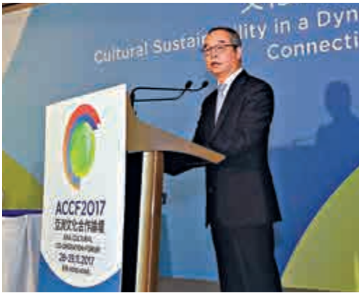
▲劉江華指，香港呈現多樣性的文化

多樣化與生物多樣化。而菲律賓北部的漁民亦是如此，他們用環境友好的方法來捕魚，以竹條編織成捕魚工具放入河中，既利用傳統知識技能將魚抓住，亦保護海洋生物多樣性。」