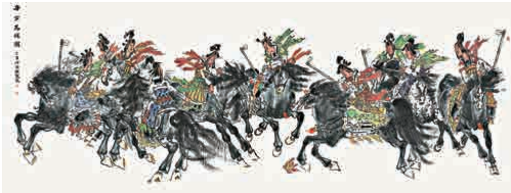
▲鄧聖作品《唐女馬球圖》