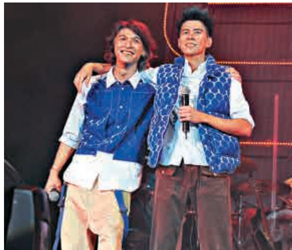
▲Shine於二〇一二年在九展開騷