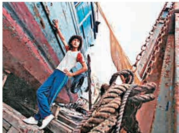
▲黃又南曾經憑《一碌蔗》獲金像獎「最佳新演員」提名