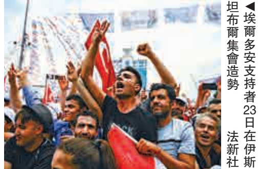
►埃爾多安支持者23日在伊斯坦布爾集會造勢