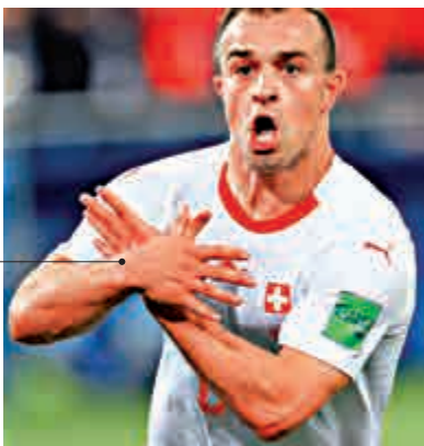
►沙基利做出阿國國旗的雙頭鷹手勢