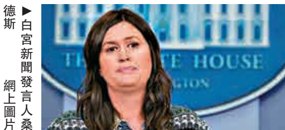
►白宮新聞發言人桑德斯

【大公報訊】據《華盛頓郵報》報道：白宮發言人桑德斯上周五與家人在弗吉尼亞州一家餐廳吃晚飯時，餐廳負責人因她「為特朗普工作」為由拒絕招待。桑德斯次日在社交平台推特（Twitter）上講述此事，稱自己被逐後禮貌地離開，並稱無論是在過去還是未來，都會一直盡力尊重那些與自己意見相左的人。 涉事的「紅母雞」餐廳老闆之一威爾金森解釋道，因為桑德斯支持特朗普禁止變性人參軍的政策，她