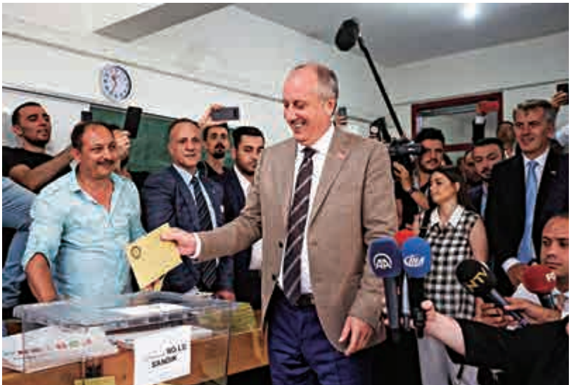
票站 ►埃爾多安頭號對手因傑（中）24日在亞洛瓦投票

【大公報訊】綜合美聯社及阿聯酋《國民報》報道：土耳其24日舉行大選，六名總統候選人參與角逐，同時八個政黨爭奪國會議席，最終結果有望於29日公布。普遍認為現任總統埃爾多安難取得過半支持率，很有可能在下旬8日與頭號競爭對手因傑進行第二輪投票。本屆大選是土耳其進入總統制後的首次選舉，而投票當日也十分混亂，有票站發生暴力行為，更傳出致命槍擊案，也有反對黨人士指控執政黨暗箱操作。