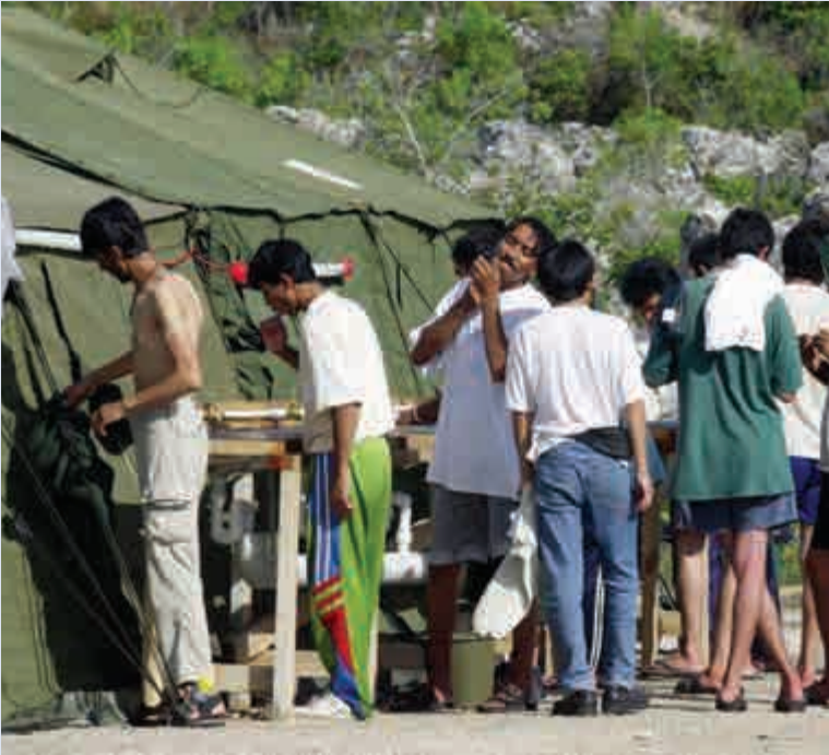
▲▶瑙魯拘留營是2012年澳洲政府為安置逃難至澳洲的難民而重啟的境外難民營，營內環境不佳，屢傳人權侵害事件 網上圖片