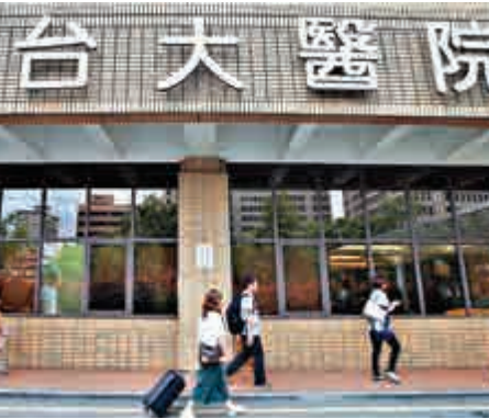
▲台大醫院發生錯用自來水洗腎的醫療事故