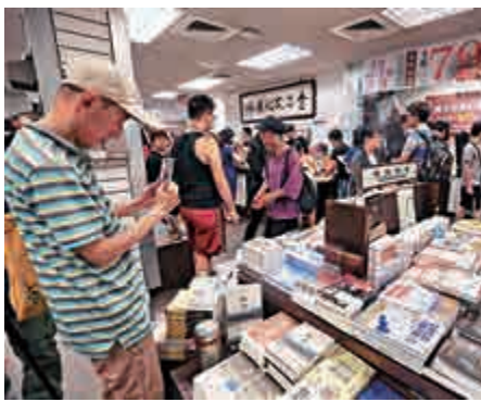
▲連鎖書店金石堂城中店24日晚間10時正式結束營業 中央社