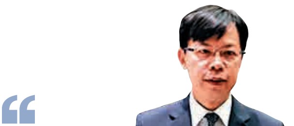
金融界立法會議員陳振英：

國家明確香港未來的發展方向，香港除了是國際金融、航運、貿易中心外，還將是國際創新科技中心。這一年特區政府無論在稅務、還是預算案調撥資源等方面，都更加積極主動，願意投入更多的資源去追落後，相信之後會看到效果。