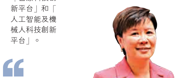
香港科技大學副校長、中國科學院院士葉玉如：

國家主席習近平對在港兩院院士來信作出重要指示，令業界爭取多年的內地科研經費「過河」問題得到解決，亦是兩地科研合作的一次「歷史性突破」，相信會極大促進兩地科研合作和吸引優秀科研人才來港，對香港發展成國際創科中心很有幫助。