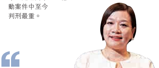
基本法委員會委員、經民聯立法會議員梁美芬：

法庭對違法「佔中」、旺暴案等一連串的判決，反映法庭是法治先行，並釋出清楚的信息，任何違法的行為都要負上法律後果，不可以因為政治目的就肆無忌憚地踐踏法律。