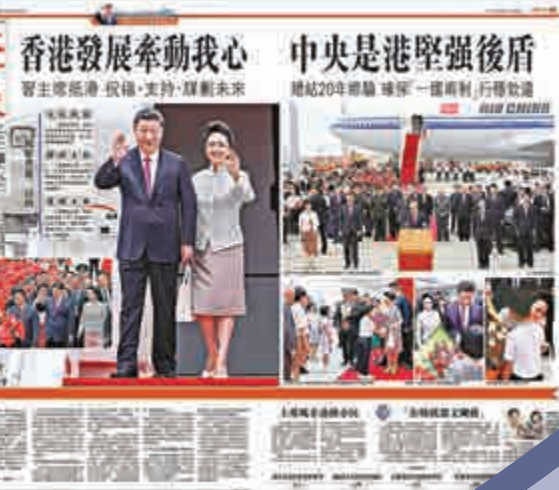
▲大公報去年以時版報道習主席乘坐專機抵達香港的盛況

國家主席習近平對在港兩院院士來信作出重要指示，令業界爭取多年的內地科研經費「過河」問題得到解決，亦是兩地科研合作的一次「歷史性突破」，相信會極大促進兩地科研合作和吸引優秀科研人才來港，對香港發展成國際創科中心很有幫助。