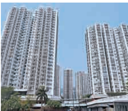
▲沙田中心呎價首次升穿2萬元

然而，二手頻反價，窒礙部分用家入市。據中原統計，十大屋苑周末成交急插60%至六宗，創18周新低，有六個屋苑「捧蛋」。中原地產亞太區副主席兼住宅部