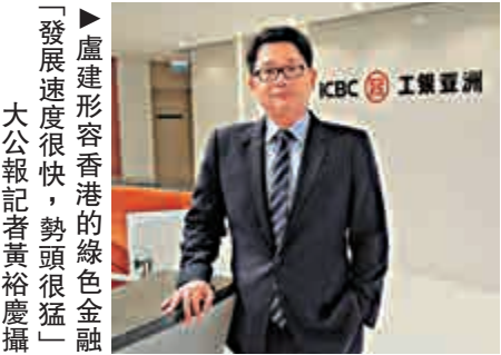
「發展速度很快，勢頭很猛」

市場對工銀亞洲綠色債的認購反應熱烈，美元浮息債的發行金額總值4億美元（3年期和5年期各2億美元），認購倍數約3倍；港元2年期定息債的發行金額約26億港