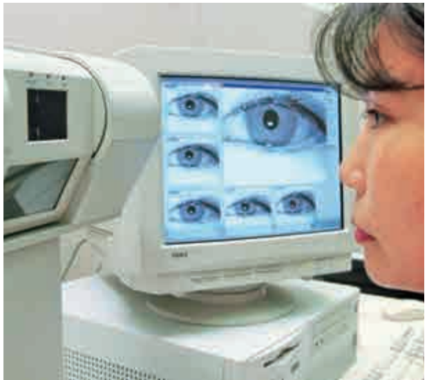
▲中國虹膜識別技術從零開始，已逐步擺脫受制於人的局面 資料圖片