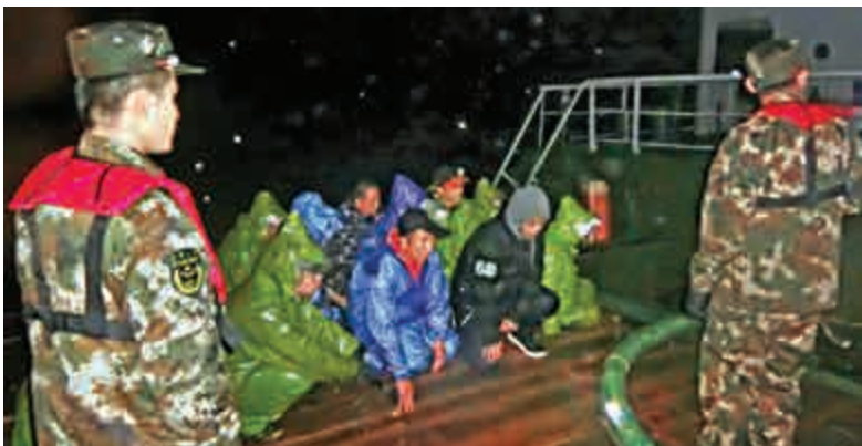
▲上海海警近月開展掃黑除惡專項行動，查獲多宗涉海成品油違法行為 資料圖片

同表現，有針對性地推動完善打擊思路、政策、舉措。要在依靠群眾、發動群眾上下功夫，堅持開門搞督導，突出群眾意見在督導工作中的權重，請群眾參與、監督、評判，打一場掃黑除惡的人民戰爭。