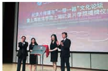
▲24日，上海紀錄片學院揭牌儀式在滬舉行

業的發展需求，聚集校內外優質的傳媒教育資源，努力打造的一個旨在培養創新型、應用型和國際化傳媒人才的特色學院。