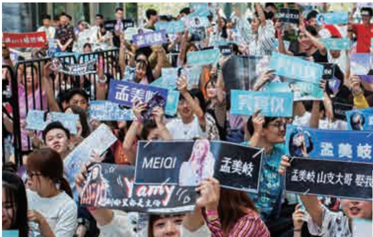
▲「全民票選」的賽制引發粉絲狂熱