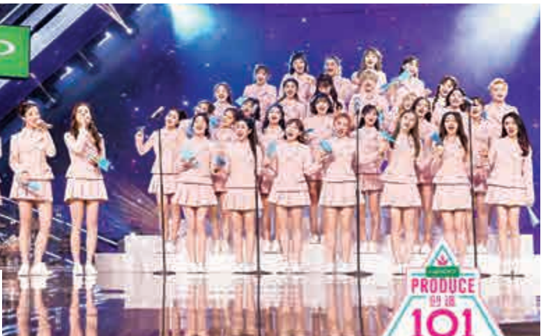
▲一輪淘汰後留下的36位練習生齊唱《仰望星空》以感謝創始人

在剛剛過去的星期六，一路製造網絡熱話、引起全民狂熱的《創造101》終於落幕，一支十一人中國女團隨之成立。記憶中，上一個現象級的選秀節目還是2005年的《超級女聲》。從草根到練習生，從觀眾到創始人，從短訊投票到網絡點讚，從中國選秀第一人李宇春到今天的「火箭少女101」……在這13年的進階過程中，關於選秀類節目的一切已然改變，不曾改變的只有粉絲對偶像的「愛的供養」。