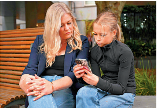
▲澳洲社交媒體禁令將於12月10日生效。圖為一名12歲女孩在家長旁瀏覽社交媒體。

也有專家認為，即使落實社媒使用禁令，青少年兒童上網依然面臨眾多風險。交友網站及遊戲平台不在規管之列，AI聊天機器人近期也因鼓吹自殺或與未成年人出現「感性對話」而備受關注。澳洲政府同時也在考慮把禁令擴大至網絡遊戲。據報道，Roblox和Discord等遊戲、聊天平台近來陸續在部分功能上加入年齡檢查。批評人士也對社媒平台為驗證用戶年齡而需要大規模收集和儲存數據，以及數據可能被濫用表示擔憂。