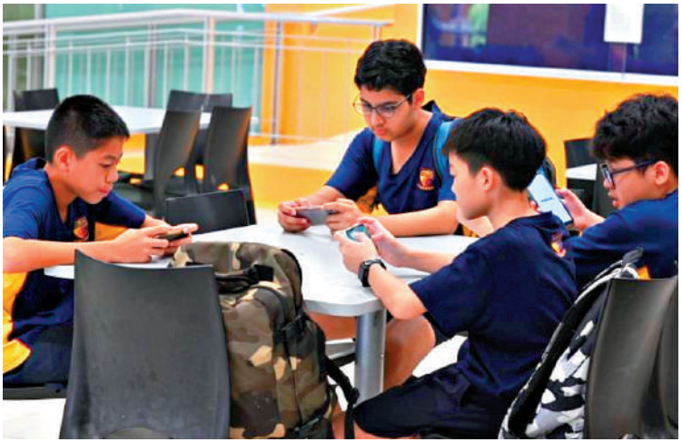
◀新加坡一所中學的學生進入課室前，將手機放進外面的儲物櫃。