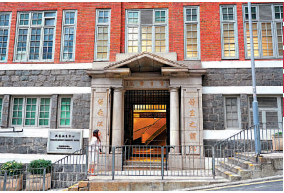
▲舊贊育醫院主樓現時為社區中心。