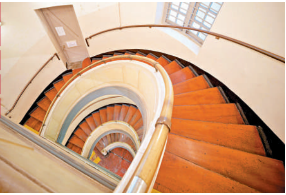
▲舊贊育醫院大樓內的螺旋形樓梯。