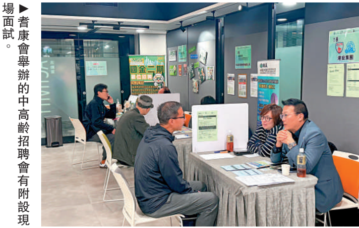
▲耆康會舉辦的中高齡招聘會有附設現場面試。