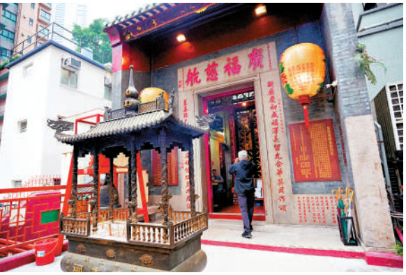
▲上環廣福祠有「百姓廟」之稱。