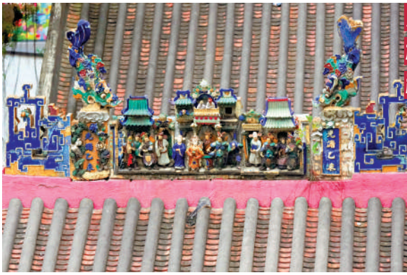
▲廣福祠前廳正脊上的石灣陶塑脊飾非常有特色。

築包括廣福祠被清拆。1895年，由華人精英籌集資金重建的廣福祠建成，安放離世華工的神主牌，並供奉地藏王、濟公等神明。廟宇部分土地分配予保良局興建辦事處，廣福祠正門旁邊的碑石，見到有關義借土地予保良局的記載。 廣福祠主要以青磚和花崗石建成，正門上方的花崗石匾額刻有「廣福慈航」，意為福祉和慈悲。前廳正脊上的石灣陶塑脊飾，取材自《封神演義》故事，是1895年重建時由佛山石灣吳奇玉店燒製，兩旁各有鯢魚和獅子，非常精緻。