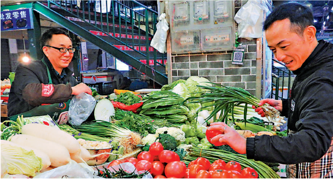
◀克服「供強需弱」問題，是未來一段時間需要面對的宏觀經濟重大課題。