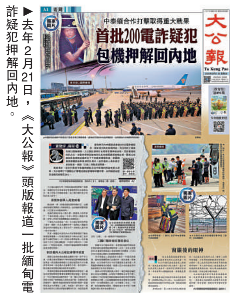
▶去年2月21日，《大公報》頭版報道一批緬甸電詐疑犯押解回內地。

在這些外媒的評論區，許多外國網民更是稱讚中國做法才是在保護人權，伸張正義。一些外國網民甚至希望自己的國家也可以拿出像中國一樣的力度去打擊詐騙犯罪。 環球時報