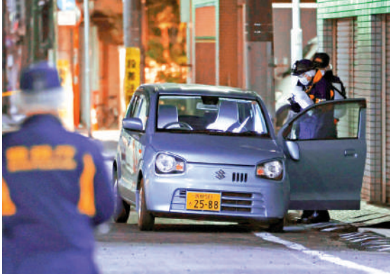
▲疑屬於搶劫4.2億日圓3人團夥的藍色微型車被遺棄在日本東京案發現場附近。

【大公報訊】據微信公眾號「中國駐日本大使館」1月30日消息，駐日本大使館再次提醒中國公民近期避免前往日本。針對中國公民東京街頭遭搶劫事，中國駐日本大使館昨日表示，已向日本警方提出交涉，要求日方盡快破案，切實保