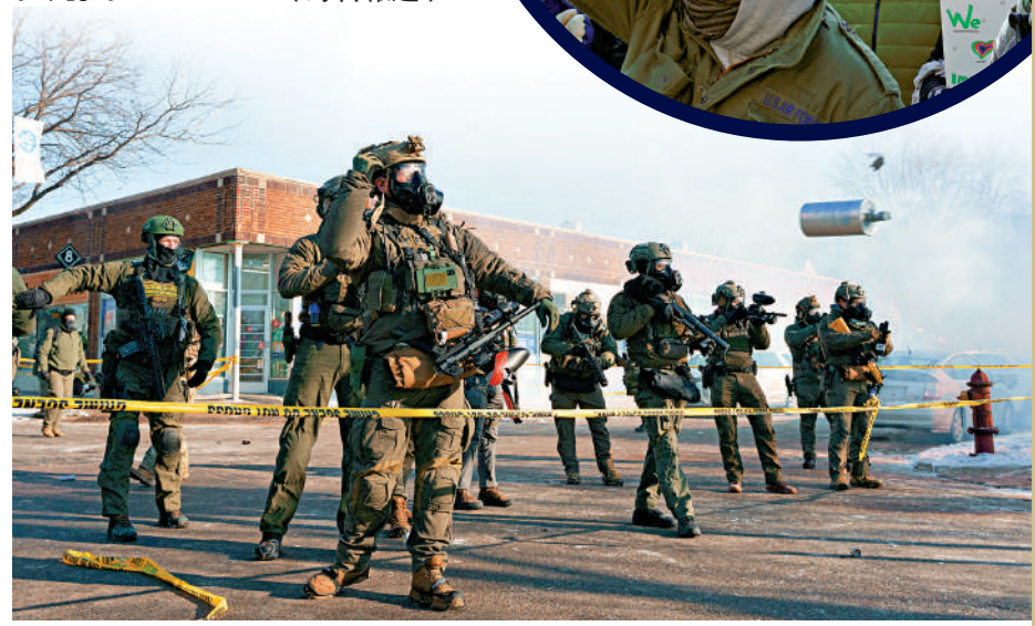
▲一名聯邦特工在明尼阿波利斯市投擲催淚瓦斯罐。

《紐約時報》與錫耶納學院於1月12日至17日進行的一項民調顯示，61%的選民認為ICE的執法手段「太過火」；僅36%的選民認可ICE的工作方式，63%表示不認可。（綜合報道）