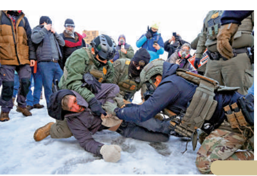
▶ 聯邦特工在明尼阿波利斯市逮捕示威者。

美國《大西洋》月刊評論文章認為，美國執法文化已然崩潰，殘暴和非人性化理念深植在許多執法部門內。近年來，美國社會對暴力執法的投訴屢見不鮮，但受懲罰的執法人員寥寥無幾。 此外，美國槍支氾濫與警察暴力執法之間也形成了一種「暴力循環」。美國是世界上民間槍支支持量最多的國家。多家機構估算，美國2024年民間擁有槍支數量約為4億至5億支，超過美國3.4億多的人口總數。 大公報記者 郭嘉