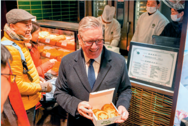
▲斯塔默在豫園購買了一盒由中華老字號綠波廊出品的蝴蝶酥。