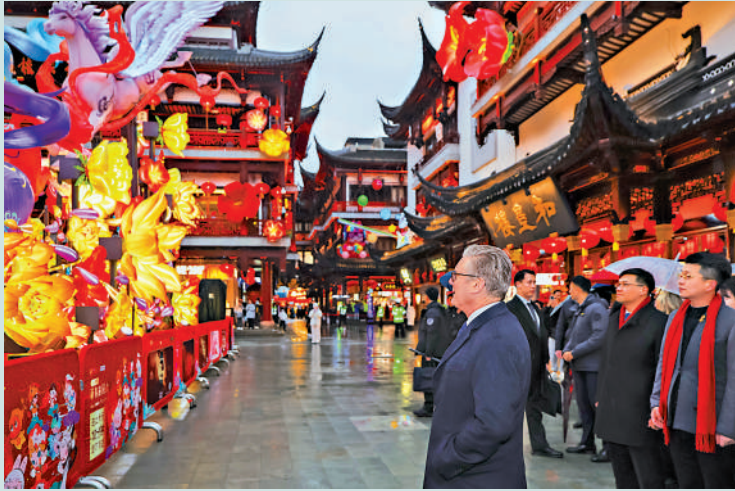
▲1月30日，英國首相斯塔默在上海豫園欣賞主題花燈。

NBC援引法國巴黎亞洲中心學者讓一皮埃爾·卡貝斯坦的話指出，在美國政策不確定性不斷上升的全球環境中，各國正以更加現實和務實的態度看待中國。《華爾街日報》報道認為，斯塔默此次訪華，是美國二戰後盟友在全球範圍內尋找新機遇的最新例證，其目的在於對沖與華盛頓在貿易和外交關係上的不確定性。