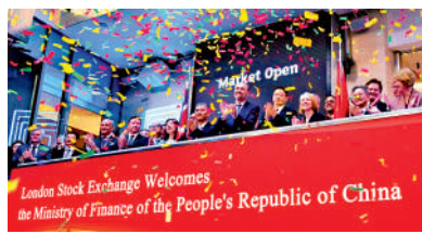
▲去年中國在倫敦首度發行人民幣綠色主權債券。

2025年1月輪流舉行十一次對話。倫敦是全球領先的外匯中心，也是最大、最具活力和最具創新性的人民幣離岸市場之一，中國對國際金融合作需求日益增長，兩國間存在得天獨厚的互補優勢。