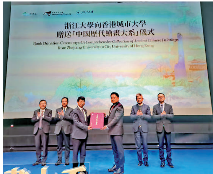
▲浙江大學向香港城市大學贈送「中國歷代繪畫大系」第一卷。《先秦漢唐畫全集》第一卷。

長，宋韻文化淵源深厚。浙港兩地文化聯繫緊密，從宋皇臺的歷史印記到龍泉青瓷的考古發現，均是雙方共享的文化遺產。他希望香港市民能通過宋畫感受跨越時空的情感共鳴，並期待以「大系」為橋樑，進一步深化推動兩地文化的交流與合作。