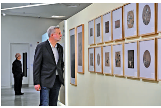
▲「中國歷代繪畫大系」成果展展廳現場。中新社

「中國歷代繪畫大系」是一場始於2005年的一項規模浩大、縱觀歷史、橫跨中外的國家級重大文化工程，共收錄海內外263家文博機構的紙、絹（含帛、綾）、麻等材質的中國繪畫藏品12405件（套）。其中國內藏品9155件（套）、國外藏品3250件（套），涵蓋傳世「國寶級」珍品，編纂出版《先秦漢唐畫全集》《宋畫全集》《元畫全集》《明畫全集》《清畫全集》，共計68卷257冊，是迄今為止同類出版物中精品佳作收錄最全、出版規模最大的中國繪畫圖像文獻。