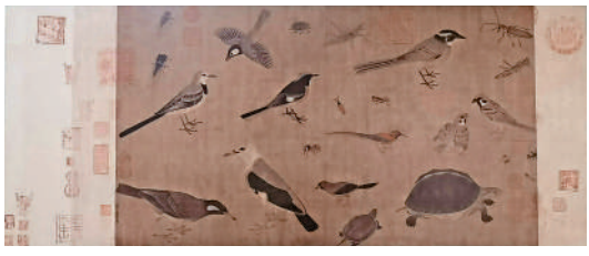
▲「草木敷榮」展區展出展畫作品《寫生珍禽圖》。